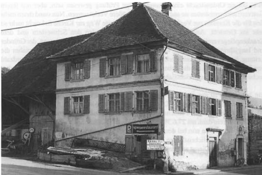
Die Post kurz vor dem Abbruch 1965. Von 1928 bis 1963 wohnten im zweiten Stock die Krankenschwestern.