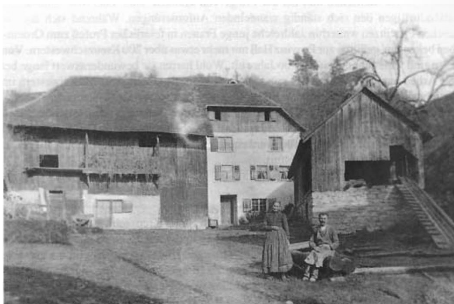
Draiers Seogo am Holzerbach im Unterlinden. Hier wohnte bis 1924 Agatha Böhler, die mit ihrem Besitz den Grundstein für den Krankenpflegeverein legte.

Nach Agatha Böhlers Tod am 18. September 1924 wurde ihrem Wunsch entsprechend die Stiftung gegründet, die vier Grundstücke wurden in die Stiftung eingebracht.